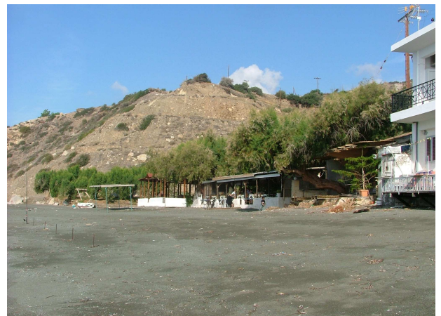
Tertsas tijdens de wegverharding??